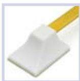
3529 selbstklebend selfadhesive autocollant