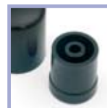
Innenteil 200 inner part 200 pièce int. 200